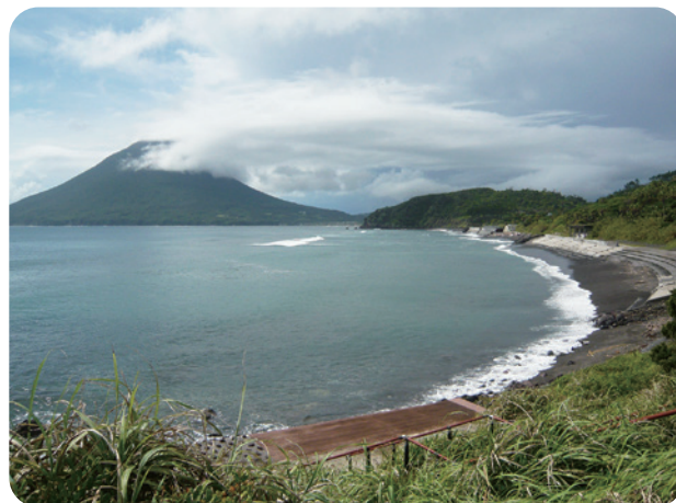
砂むし温泉 指宿白水館