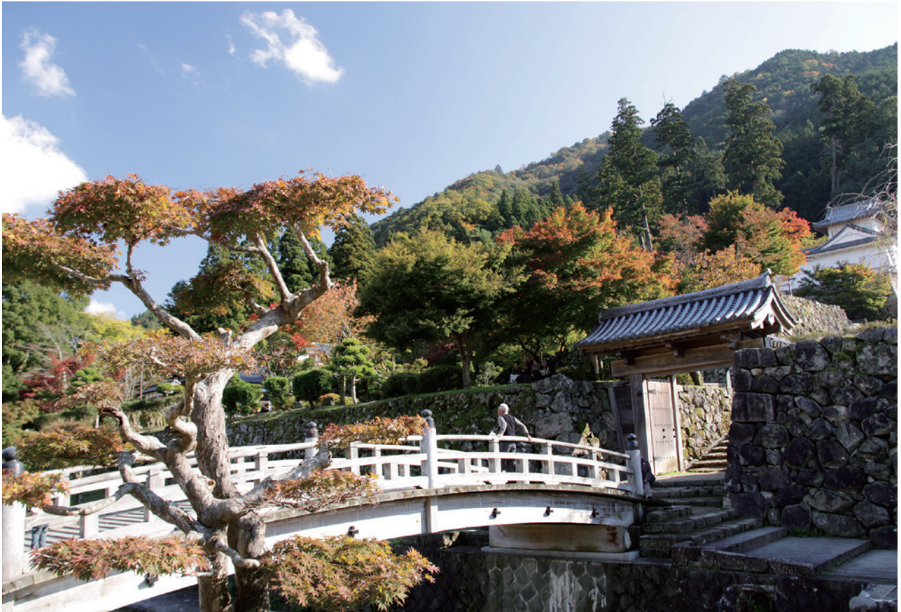
出石城跡