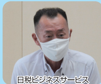
目税ビジネスサービス